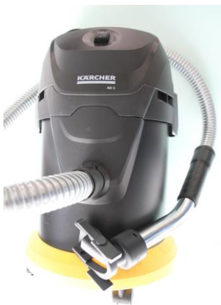
ASPIRATEUR CONSEILLE Kärcher AD3

Pour retirer la bouche, écarter les leviers pour déclipser les tétons. Tirer en arrière l'ensemble par les leviers.